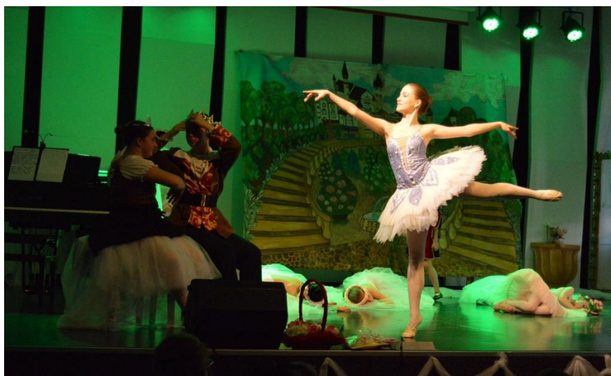
Taneční představení – Šípková Růženka